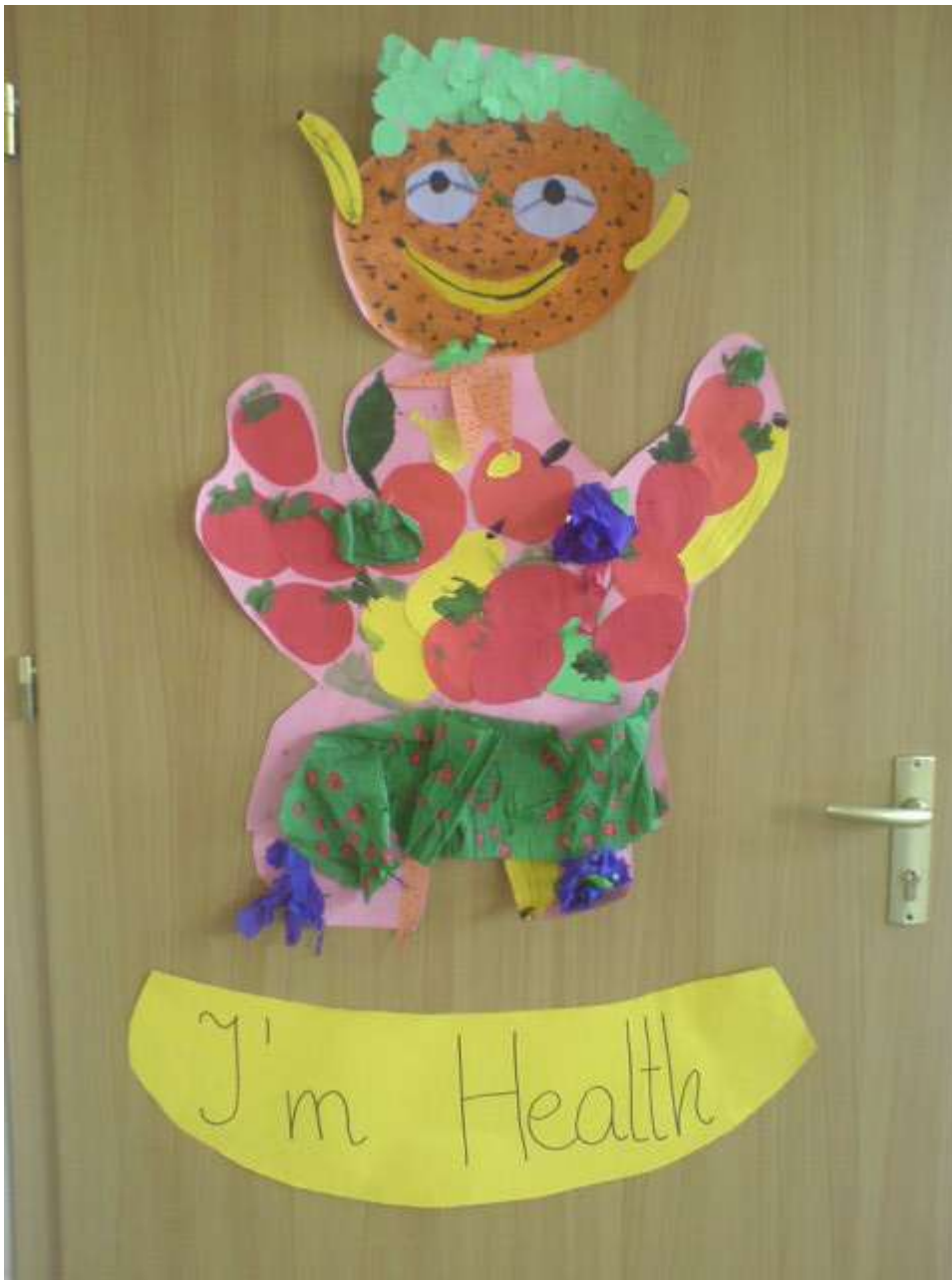
Zdjęcie 1 - Kl. VI b - 1 miejsce