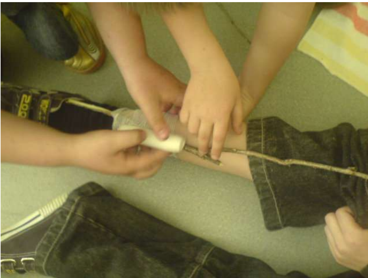
Zdjęcie 4 - lekcje udzielania pierwszej pomocy...