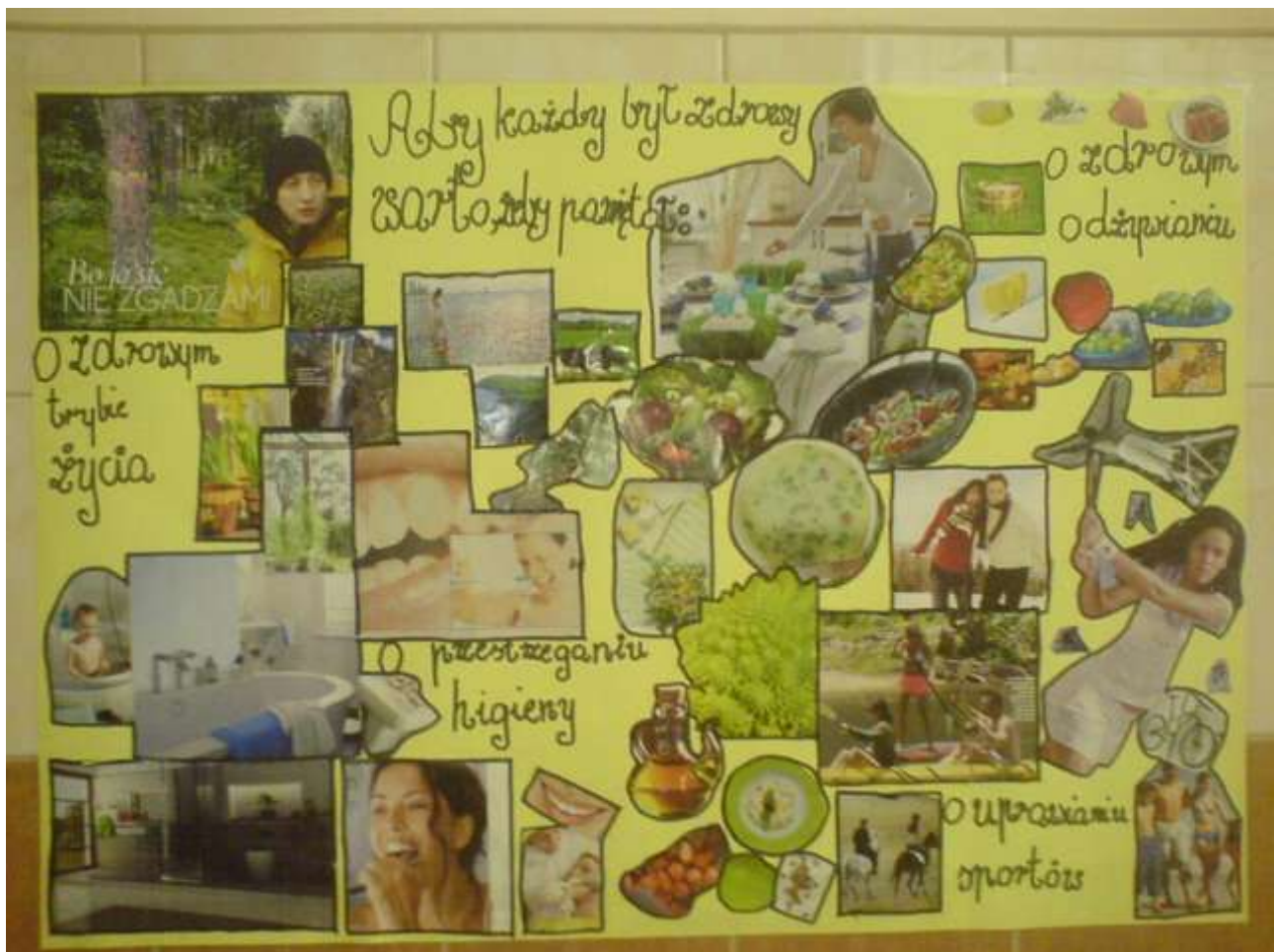
Zdjęcie 7 - Kl. II b - wyróżnienie