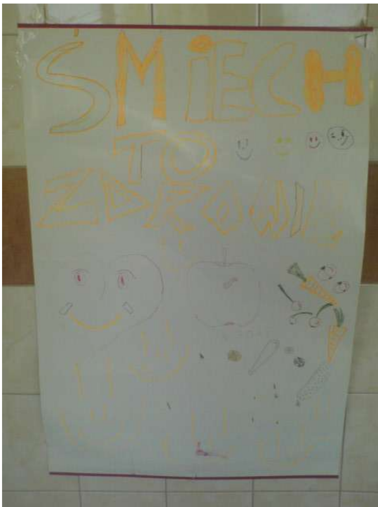
Zdjęcie 6 - Kl. VI a - dyplom za udział w konkursie