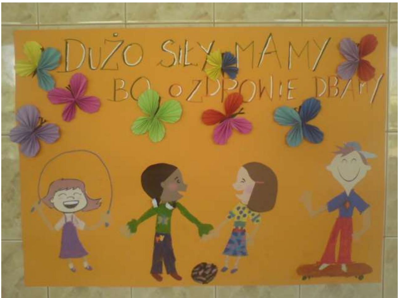
Zdjęcie 4 - Kl. I c – wyróżnienie