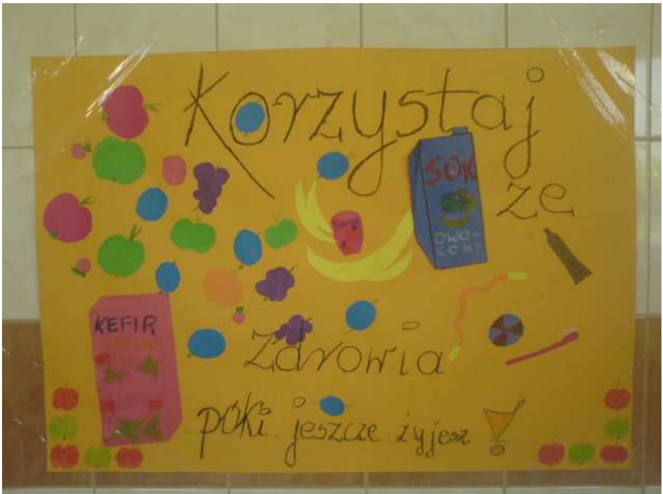
Zdjęcie 5 - Kl. IV c - dyplom za udział w konkursie