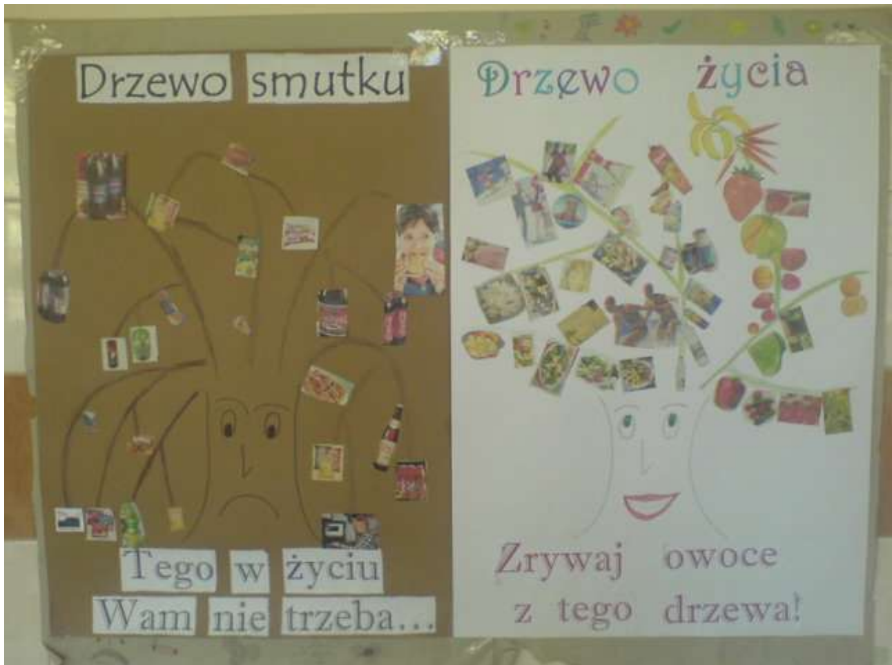
Zdjęcie 6 - Kl. II a – wyróżnienie