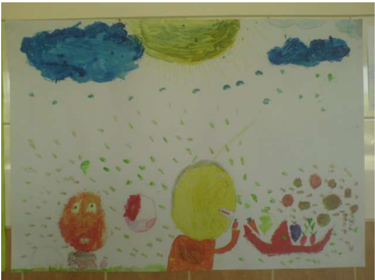
Zdjęcie 5 - Kl. I a - wyróżnienie