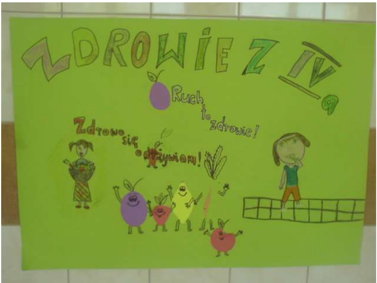
Zdjęcie 4 - Kl. IV a - dyplom za udział w konkursie