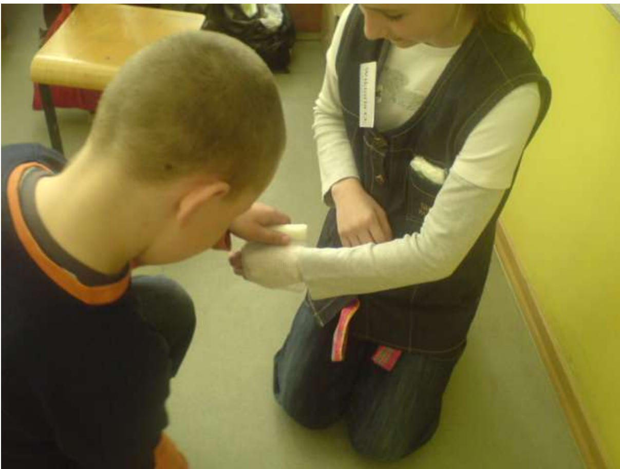
Zdjęcie 3 - lekcje udzielania pierwszej pomocy...