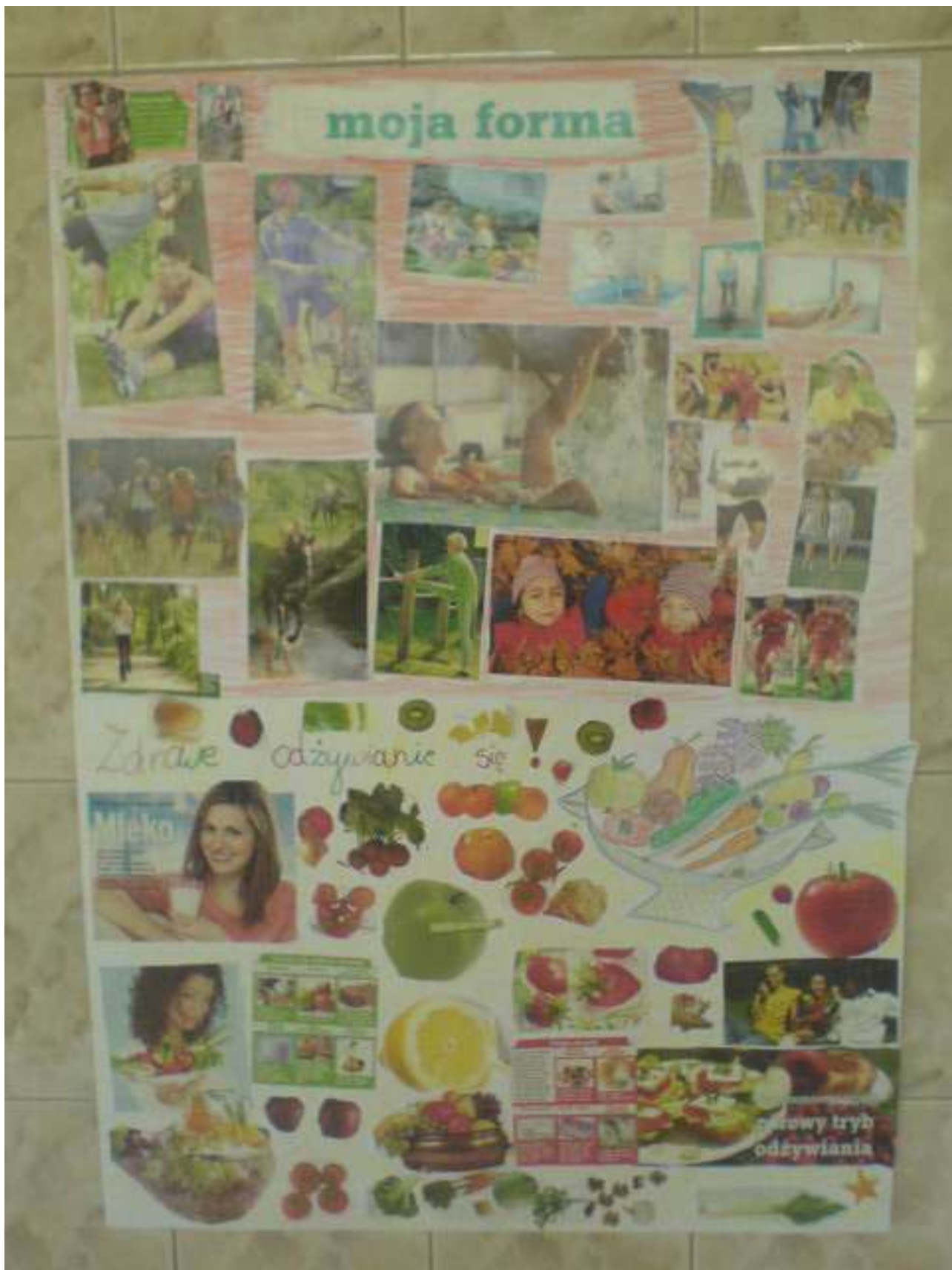
Zdjęcie 9 - Kl. III c - dyplom za udział w konkursie