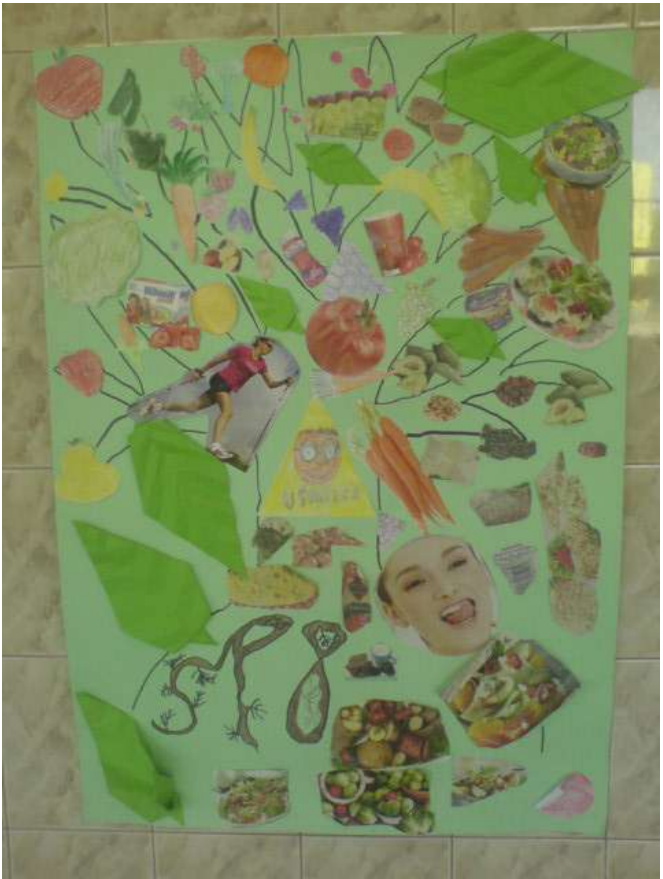
Zdjęcie 8 - Kl. III b - wyróżnienie