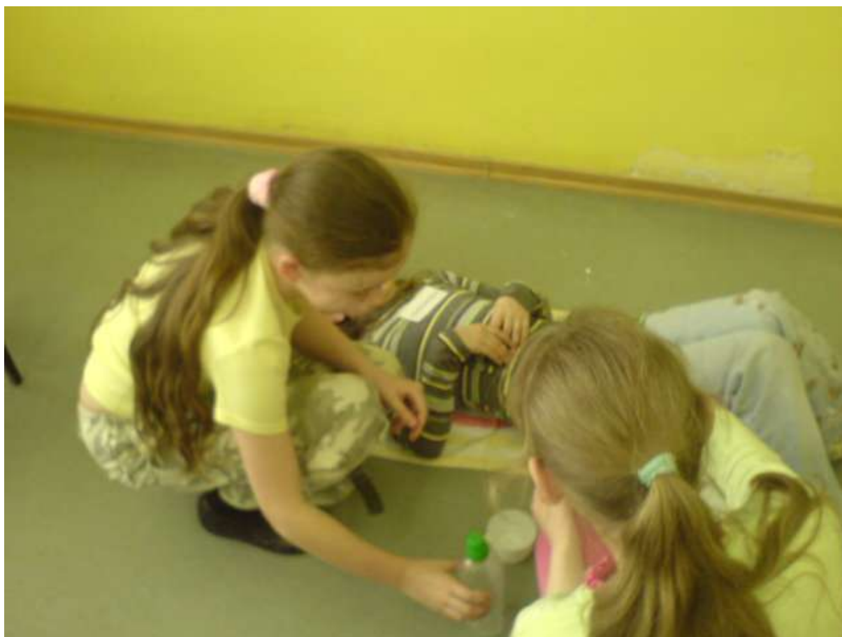
Zdjęcie 1 - lekcje udzielania pierwszej pomocy w klasach drugich