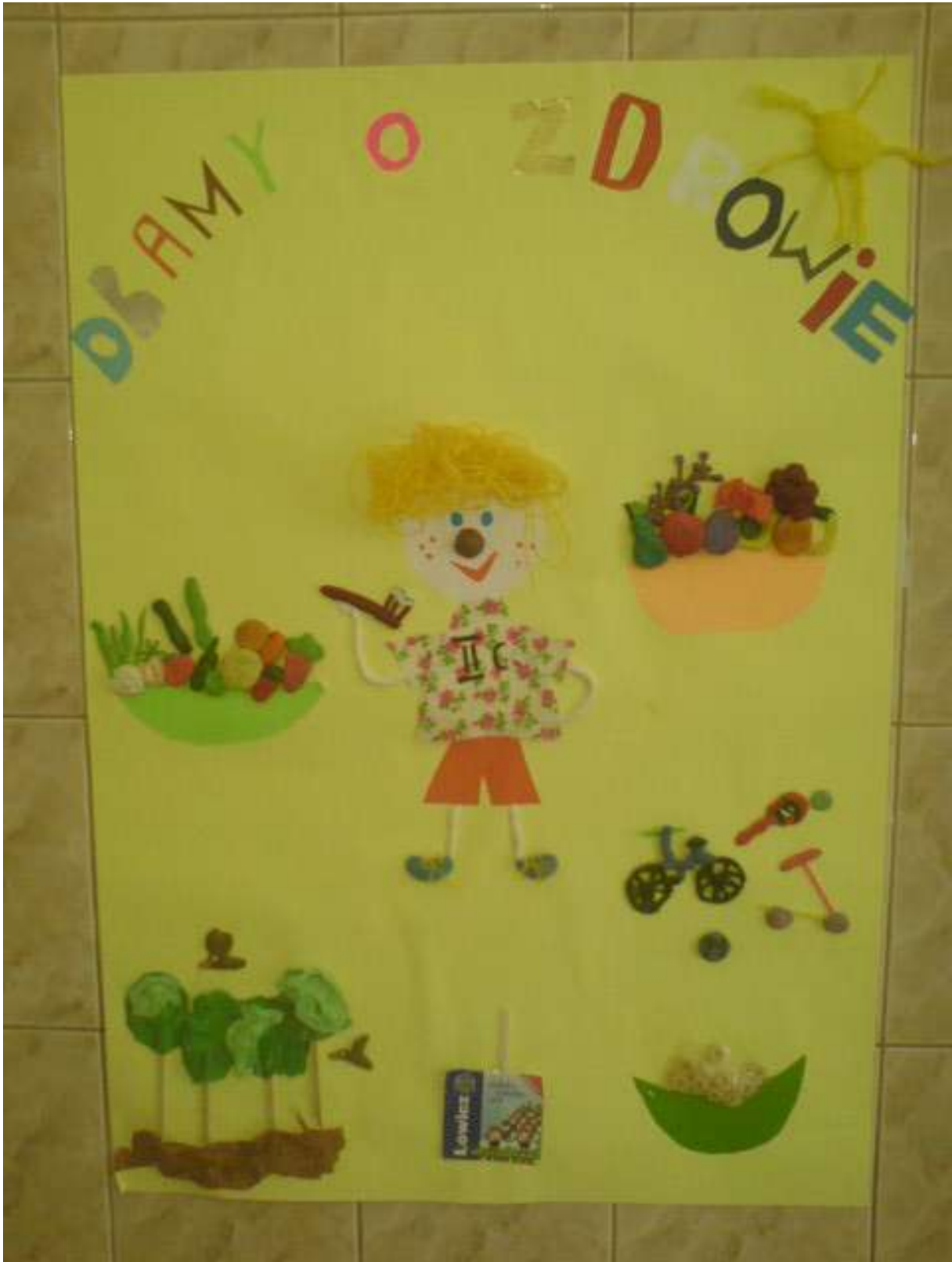
Zdjęcie 1 - Kl. II c - 1 miejsce